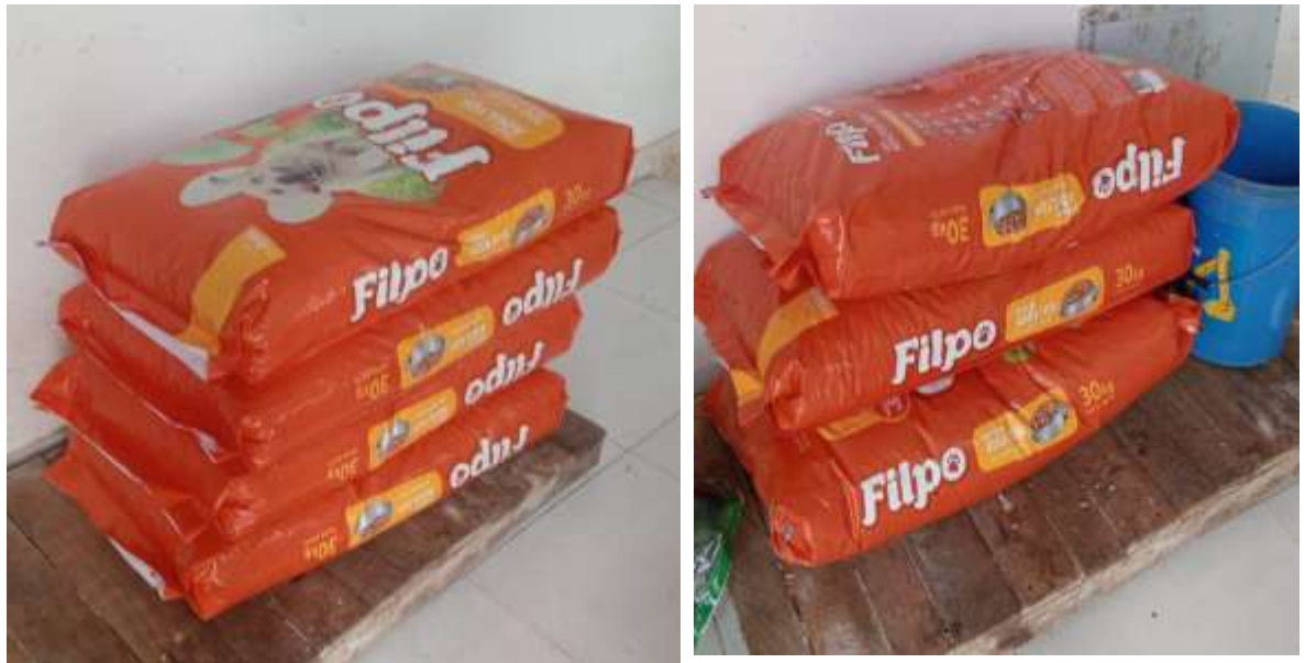
Alimento concentrado para caninos (adultos) 30 Kg